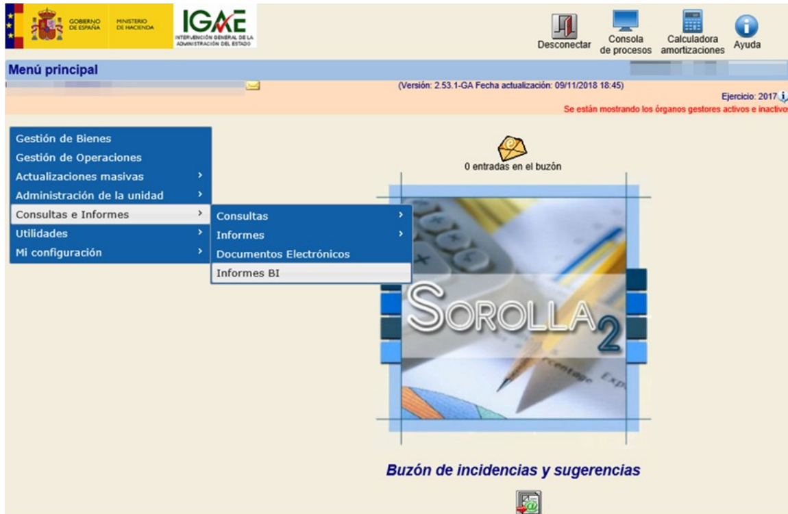
Ilustración 1. Nuevo menú Informes BI

El primer informe diseñado, “Preselección de bienes” ofrece según el ámbito de visibilidad del usuario que lo solicita, un resumen del número de bienes y operaciones que integran el inventario de su centro agrupados por naturaleza.