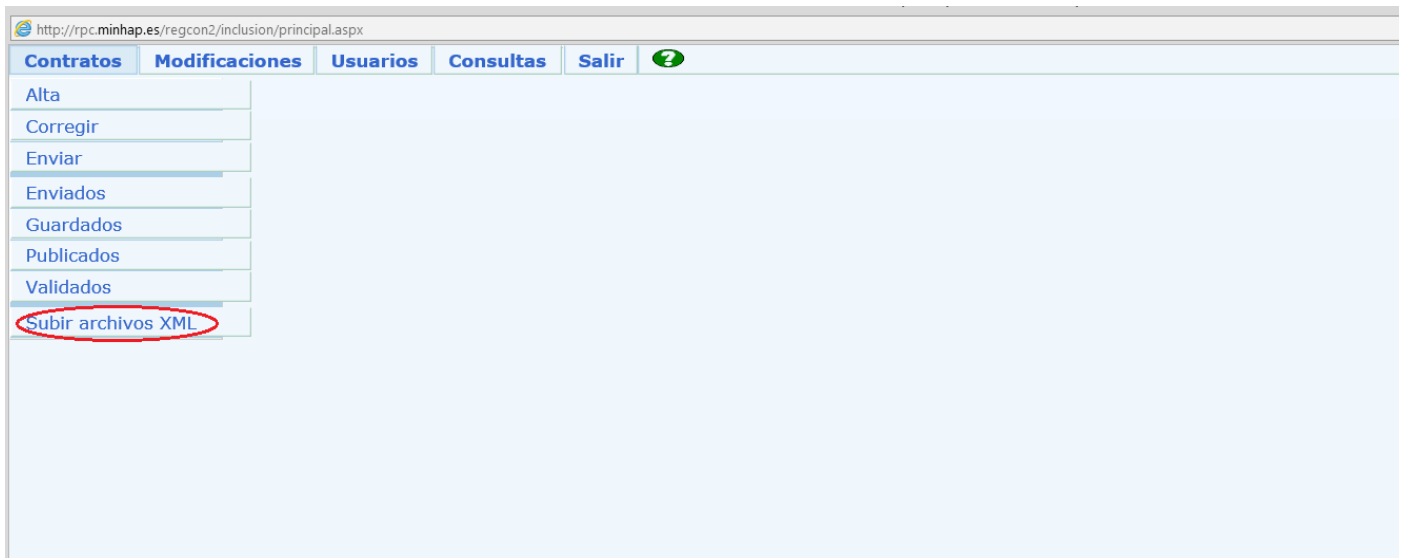
Ilustración 4: Acceso a la carga de fichero XML

A continuación, el gestor debe seleccionar el fichero XML que se ha descargado de SOROLLA2 en su equipo personal (opción Examinar ) y pulsar Guardar . El sistema del RPC le mostrará un justificante del envío realizado, como se puede observar en la siguiente.