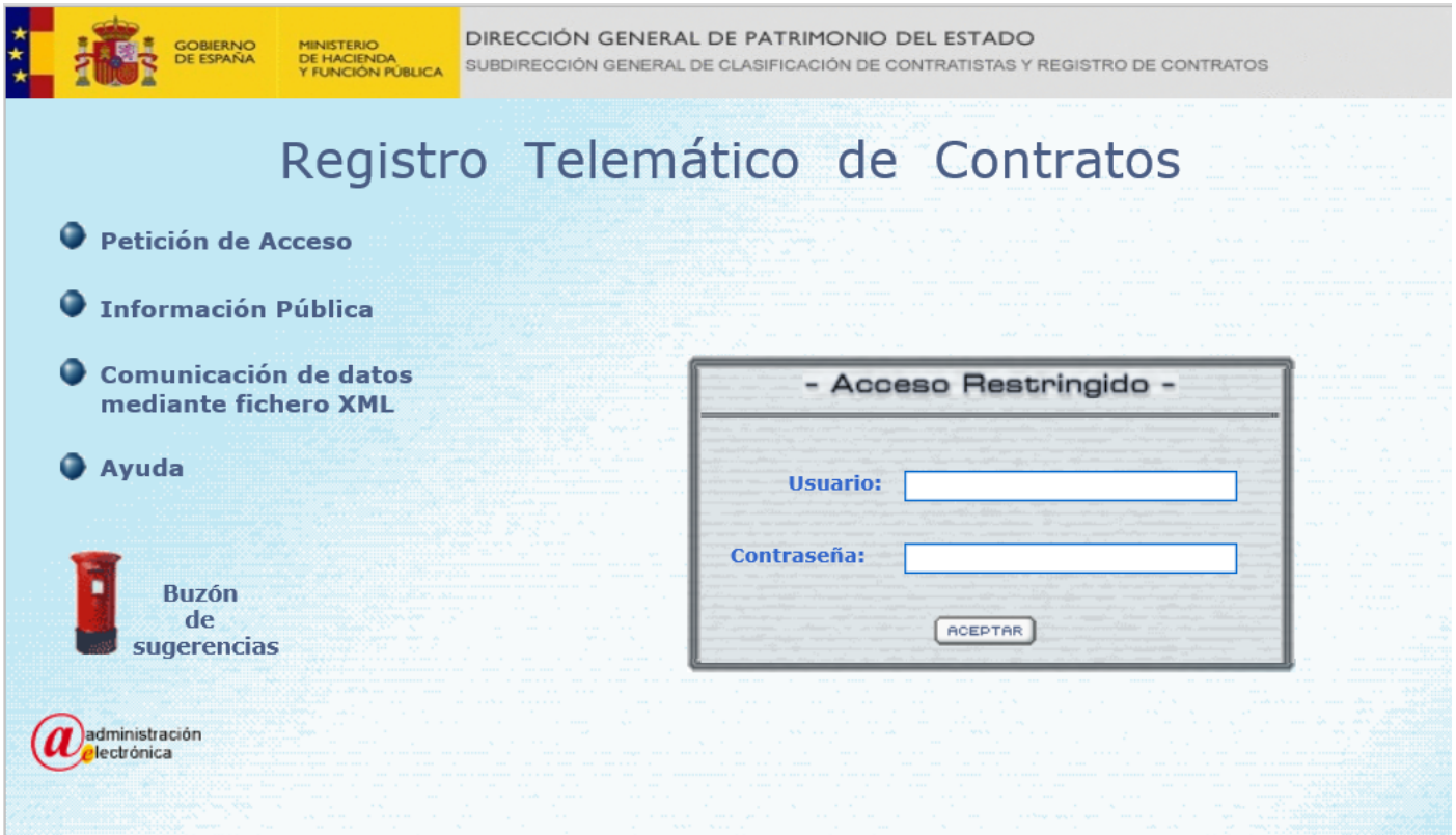
Ilustración 3: Plataforma del Registro Público de Contratos

La información más actualizada sobre la forma de trabajar con el sistema del RPC se encuentra en el manual que puede descargarse de la propia plataforma, en la parte izquierda “Comunicación de datos mediante fichero XML”. El usuario debe introducir el nombre de usuario y contraseña, en la parte central de la pantalla.