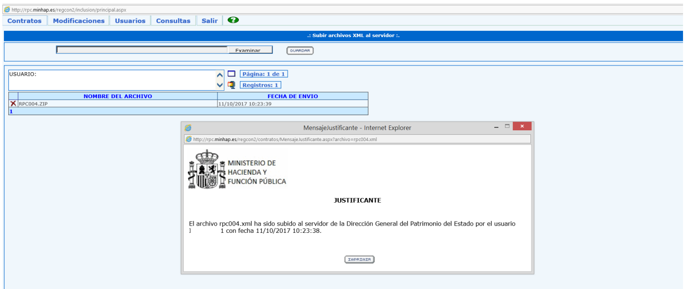
Ilustración 5: Cargar fichero XML

A continuación, el gestor debe seleccionar el fichero XML que se ha descargado de SOROLLA2 en su equipo personal (opción Examinar ) y pulsar Guardar . El sistema del RPC le mostrará un justificante del envío realizado, como se puede observar en la siguiente.